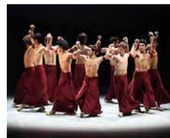
'Samsara'. / JAIME VILLANUEVA

TEATROS DEL CANAL. CEA BERMÚDEZ, 2. HASTA EL 6 DE NOVIEMBRE.