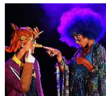
Una escena del musical.

TEATRO LA LATINA. PLAZA DE LA CEBADA, 2. SAB. Y DOM. HASTA EL 8 DE ENERO.