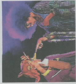
Una escena del musical.

TEATRO LA LATINA. PLAZA DE LA CEBADA, 2. SAB. Y DOM. HASTA EL 8 DE ENERO.